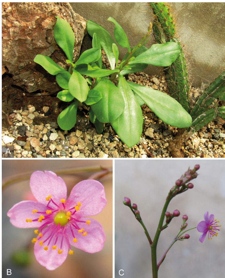
Figura 2. Talinum paniculatum (Jacq.) Gaertn.

A. Hábito de la planta, cultivada a partir de plantas de Cuba occidental, Mat, Matanzas, Punta Guanos.