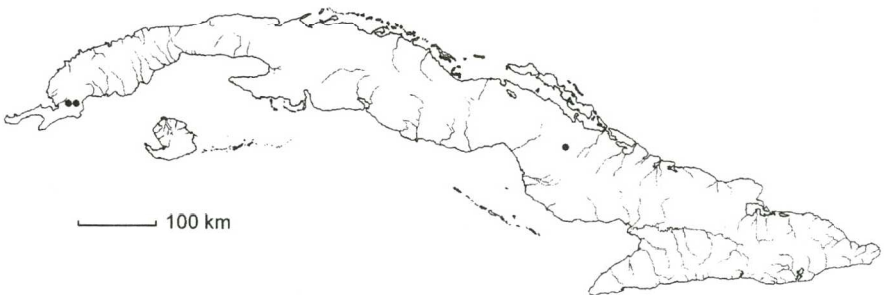
Mapa 1. Isoetes cubana Baker

= Stylites Amstutz in Ann. Missouri Bot. Gard. 44: 121. 1957 \equiv Isoetes subg. Stylites (Amstutz) L. D. Gómez in Brenesia 18: 4. 1980. Tipo: Stylites andicola Amstutz ( Isoetes andicola (Amstutz) L. D. Gómez).