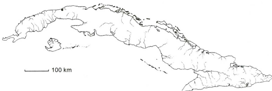
Mapa 2. Salvinia minima Baker

Tallo con un haz central en forma de O en corte transversal. Hojas flotantes orbiculares a oblongo-orbiculares, de 0,6-1,5 × 0,6-2 cm, obtusas o raramente escotadas y de base cordiforme; cara aérea con numerosas papilas cónicas de 2-3 mm de alto, dispuestas en filas entre las venas principales, cada una con 4 tricomas divergentes y libres en sus puntas. Hoja sumergida con pecíolo dividido en 2-3 ramas principales. Esporocarpos ovoides a subglobosos, algo apiculados, colgantes, dispuestos a lo largo de lacinias no ramificadas de las hojas sumergidas fértiles.