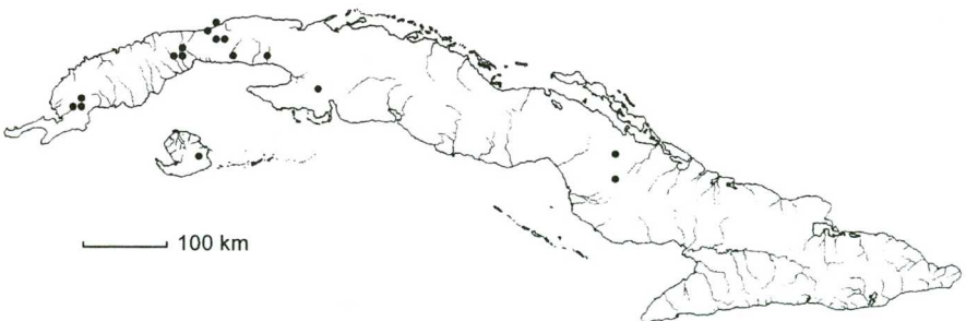
Mapa 1. Salvinia auriculata Aubl.

Distribución: América continental desde la Florida y México hasta Argentina y Bolivia, Antillas Mayores (excepto Puerto Rico). Presente en Cuba occidental: PR, Hab, C Hab, Mat (Ciénaga de Zapata: Canal de Muñoz), IJ (Ciénaga de Lanier), Cuba central: Cam (Camagüey; San Felipe). Crece en ciénagas, lagunas, presas, canales y cursos de agua de corriente lenta, expuesta al sol o en luz solar filtrada, entre 0 y 50 msm. Frecuente. — Mapa 1.