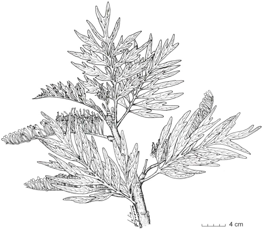
Figura 1. Grevillea robusta A. Cunn. ex R. Br. (adaptado de fuente no identificada por Julio Figueroa): Rama florecida.