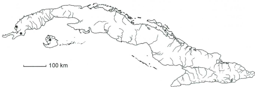
Mapa 2. Mayaca aubletii Michx.

Distribución: Estados Unidos de América, América Central, América del Sur y Antillas Mayores. Presente en Cuba occidental: PR (laguna de la Culebra en Sandino; San Francisco en Mantua), IJ (laguna de Santa Rosalía). Comúnmente en tembladeras, sobre substrato permanentemente húmedo, a veces totalmente sumergidas. – Mapa 2.